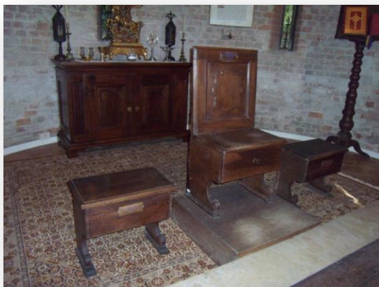
il trittico del celebrante da inviare a restauro

2. Questo ritardo, sta condizionando l'inizio dei lavori di restauro degli scranni donati da S.M. Umberto II, danneggiati in parte dall'alluvione che dieci anni fa ha coinvolto il pavimento ed il cui inizio era previsto per i primi di maggio.