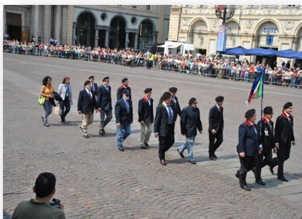
Raduno: Lo Stendardo del Tempio alla sfilata

Ho ricevuto, altresì, un completo servizio fotografico dal sig. Sebastiano Strano di Torino che provvederà a pubblicare quanto prima.